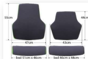
"At Work L"