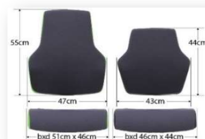
"At Work L"

Lieferzeit: - Standardfarben = ca. 4-5 Wochen nach Auftragserteilung Zzgl. Fracht & Verpackung (siehe Frachtstafelung)!! Alle Preise verstehen sich zzgl. 19% MwSt.!