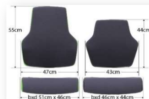
"At Work L"

Lieferzeit: - Standardfarben = ca. 4-5 Wochen nach Auftragserteilung Zzgl. Fracht & Verpackung (siehe Frachtstafelung!) Alle Preise verstehen sich zzgl. 19% MwSt.!